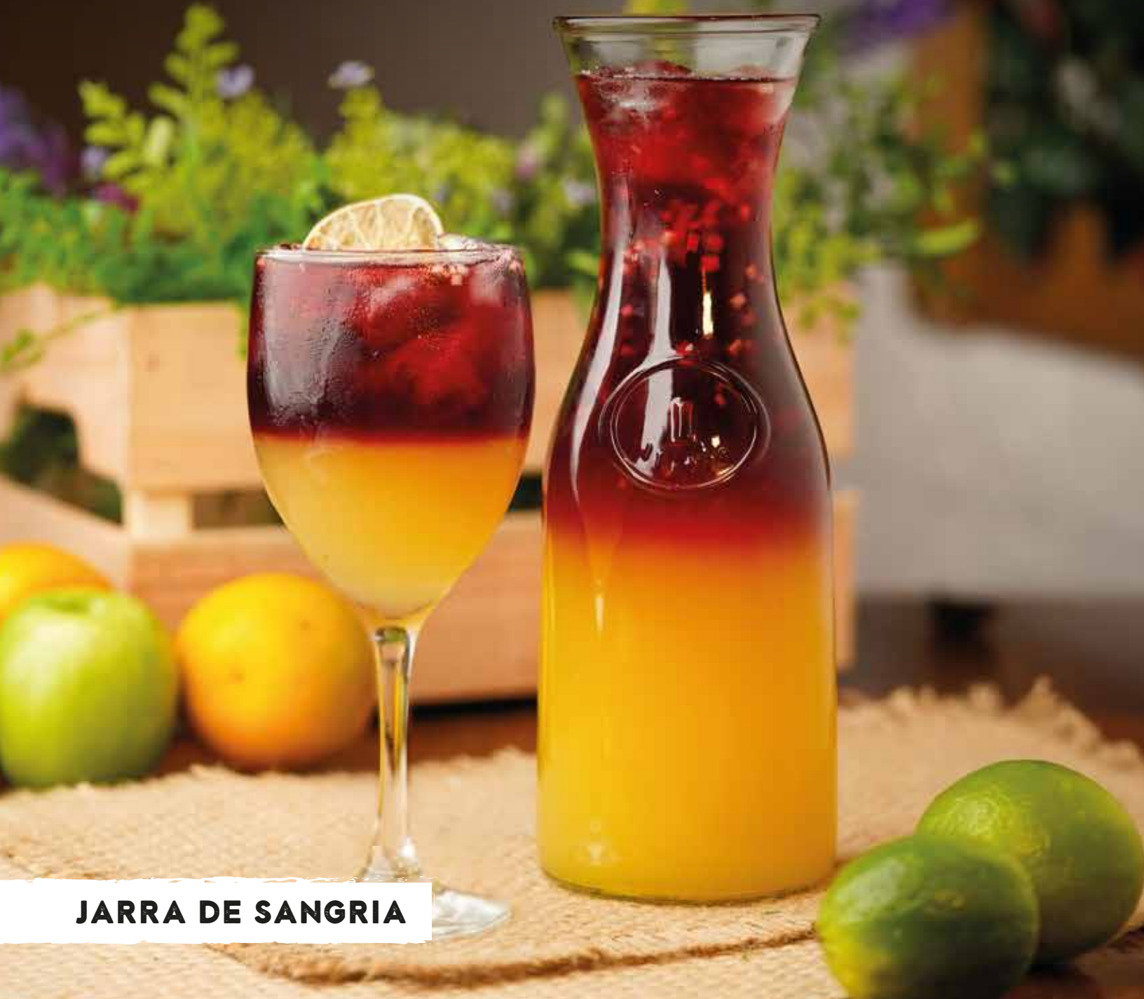
JARRA DE SANGRIA