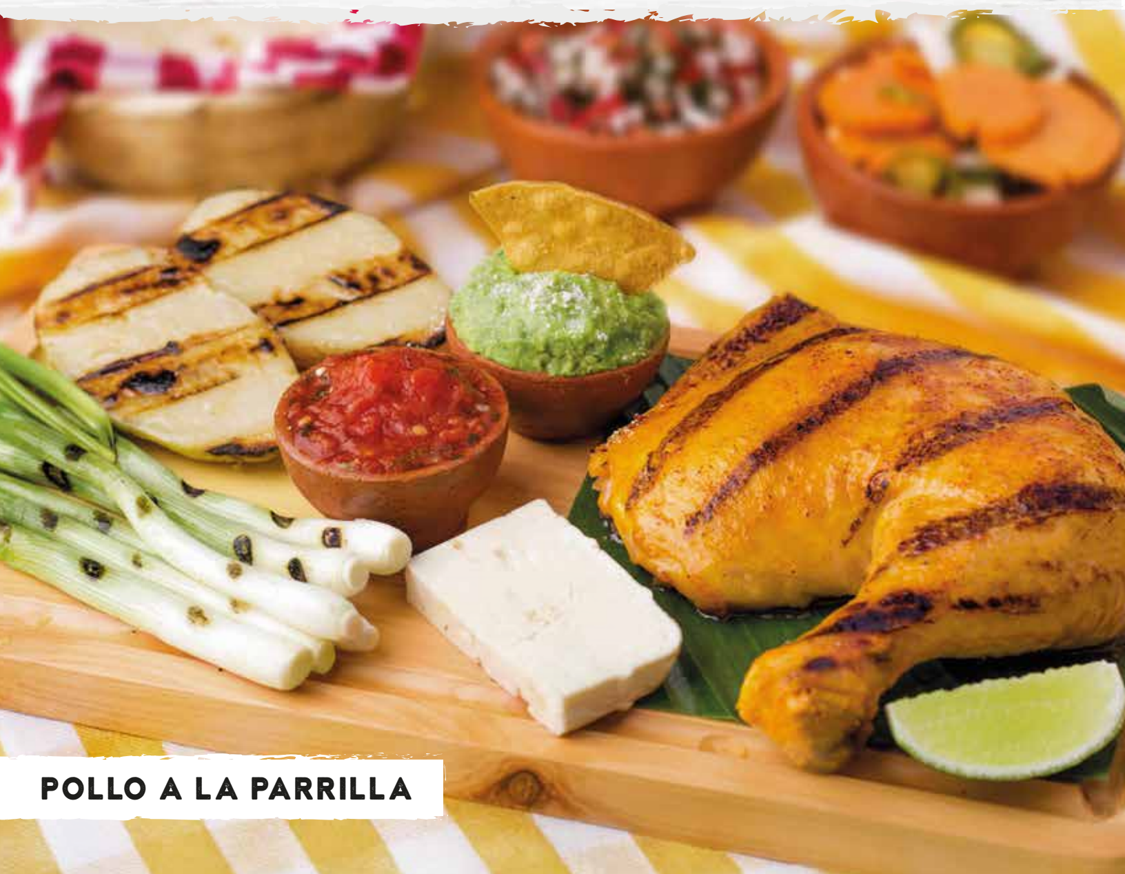
POLLO A LA PARRILLA